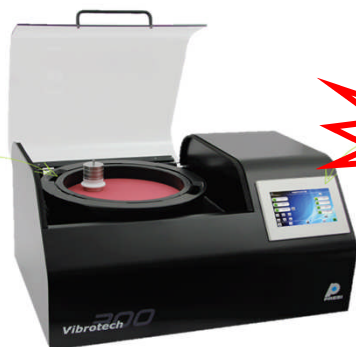
振動研磨機 Vibrotech 300