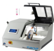
切断機 Mecatome T202