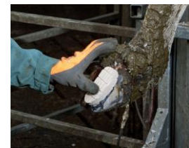
押して密着させる