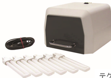
テクノトレイパワー